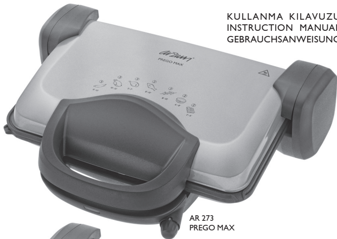
AR 273 PREGO MAX

KULLANMA KILAVUZU INSTRUCTION MANUAL GEBRAUCHSANWEISUNG