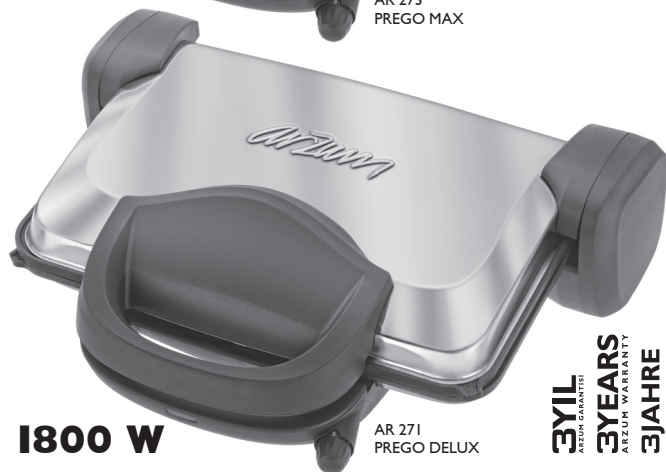
AR 271 PREGO DELUX