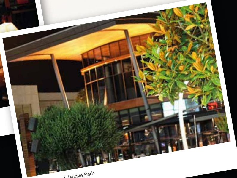
Masa Restaurant, İstinye Park